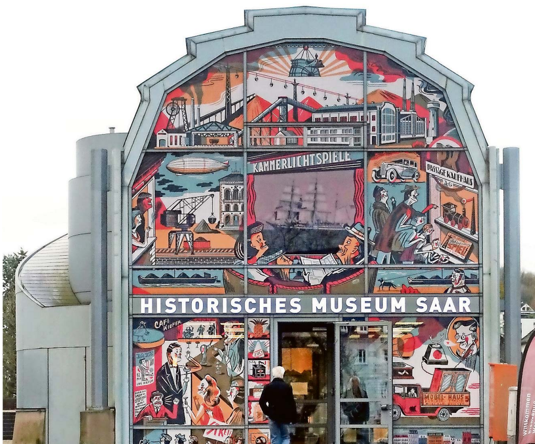
Das Historische Museum Saar am Schlossplatz spricht nicht nur eine kleine, kulturraffine Szene an, sondern auch die breite Bevölkerung.