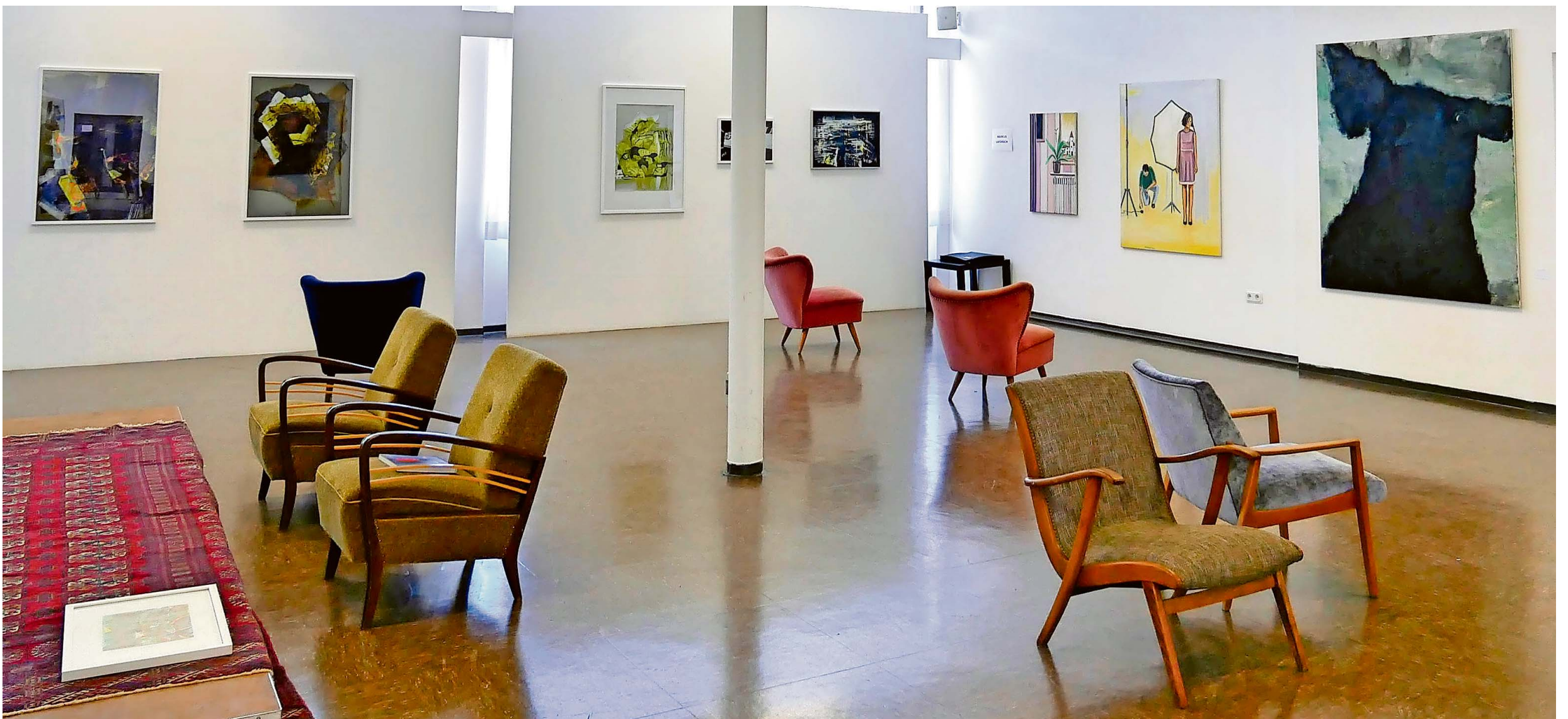
Die Kantine des KuBa wurde kurzerhand zu einem KunstKaufhaus umfunktioniert.